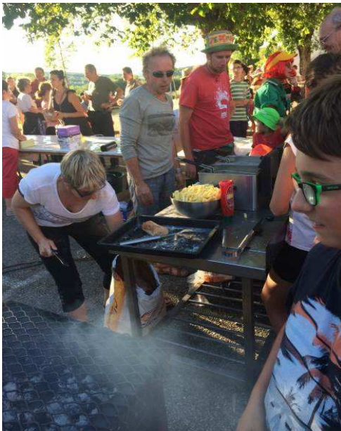
Le stand frites saucisses...