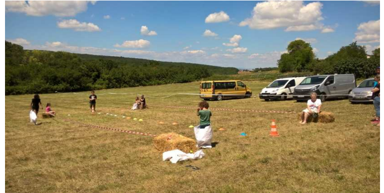
La course en sacs