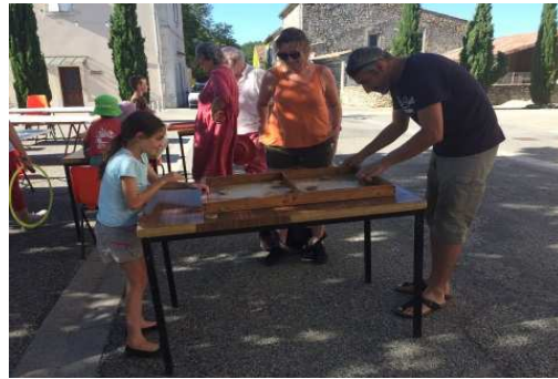
Les jeux en bois d'Archijoux