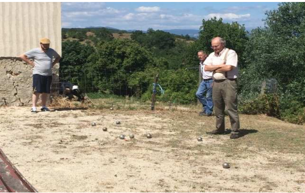
Le concours amical de pétanque