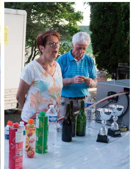
... et la buvette non-stop du Comité des fêtes !